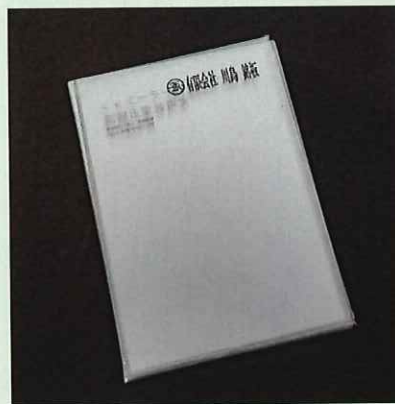
折畳状態 (A4 サイズ)

『企業イメージアップ』・・・金融機関など顧客訪問が欠かせないお仕事でお使いいただくことで企業イメージのアップにつながります。