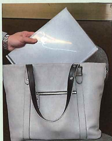
鞆に入れて持ち運びの 出来る A4 サイズ

「次回以降持参のグループ様、お会計 から〇%割引！」などなど、使い方は いろいろ！